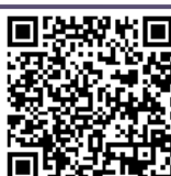
Term & Condition