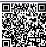
Term & Condition