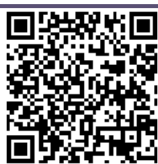
Term & Condition