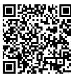
Term & Condition