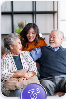
สร้างหลักประกัน ให้ตัวเองและคนที่ห่วงใย