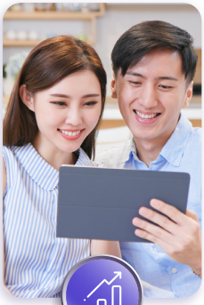
เริ่มต้นสร้างความมั่นคง ให้คนที่คุณรัก

'ยูนิท ลิงค์' ประกันชีวิตควบการลงทุนที่เติมเต็มทุกความต้องการ ไม่ว่าเป้าหมายในแต่ละช่วงชีวิตจะเป็นแบบไหน 'ยูนิท ลิงค์' ก็ช่วยออกแบบอนาคตของคุณได้