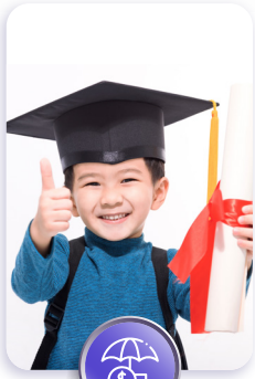
มอบอนาคตด้านการศึกษา และส่งต่อมรดกที่มั่นคง