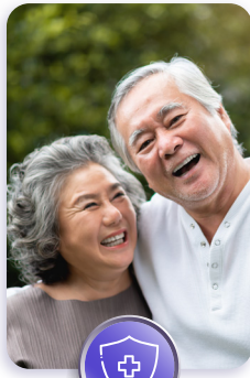
วางแผนเกษียณ เพื่ออนาคตที่มั่นคง

ประกันชีวิต...ที่ตอบโจทย์รอบด้าน ทั้ง "ความคุ้มครองชีวิต" และ "ความมั่งคั่ง" ในกรมธรรม์เดียว ด้วยการรวมเอาข้อดีของประกันและกองทุนรวมมาไว้ด้วยกัน